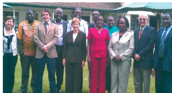
Le Groupe d'experts de l'AIU et des collègues de la MU durant la visite