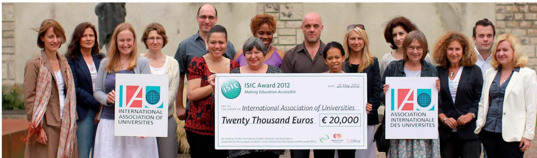
Membres du Secrétariat de l'AIU

Pour obtenir de plus amples informations et des exemplaires supplémentaires de ce Rapport annuel, veuillez consulter notre site Internet ou nous contacter à l'adresse suivante : iau@iau-aiu.net