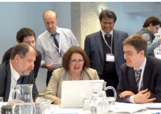
Membres du Groupe de travail préparant leurs réponses pour l'événement