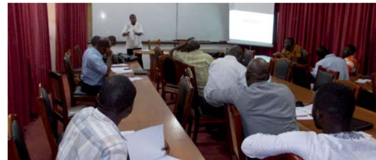
Photos prises lors des visites LEADHER