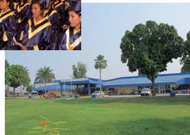
L'UCP, et quelques-uns de ses étudiants, qui accueillera la Conférence internationale 2014 de l'AIU