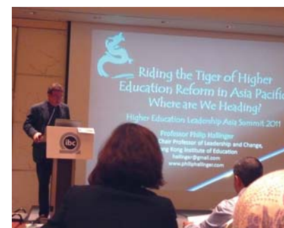
Photos de réunions dans lesquelles l'AIU a joué un rôle actif durant l'année