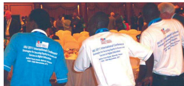
Etudiants de l'Université Kenyatta dansant lors de la cérémonie d'ouverture