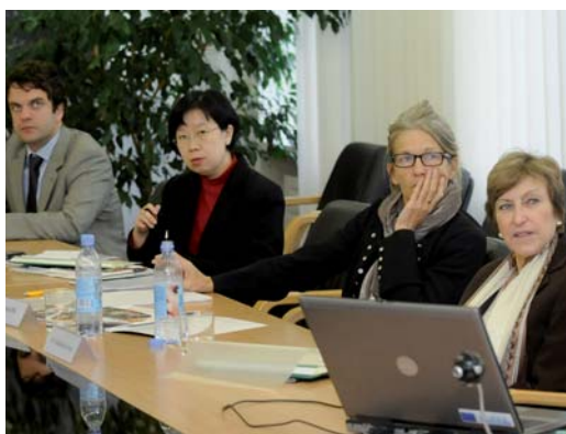
Le Groupe d'experts de l'AIU à la MRU

Les visites du groupe d'experts de l'AIU dans les deux établissements et les rapports finaux contenant les recommandations émises ont été achevés fin 2011. Le projet ISAS avec la MU a été rendu possible grâce au financement partiel du Programme de participation de l'UNESCO.