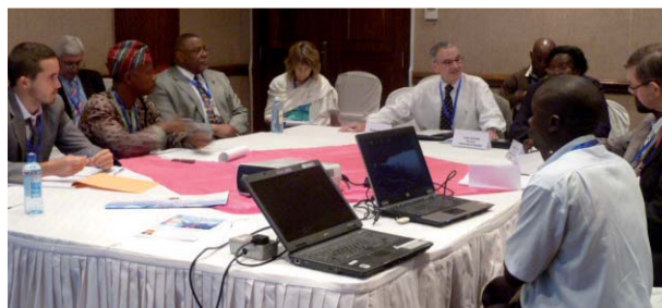
Discussions lors de l'une des sessions parallèles

Pour plus d'informations, veuillez vous rendre à l'adresse suivante : www.iau-aiu.net/content/past-events