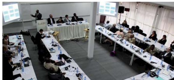
Séminaire de l'AIU et de l'ACUP à Addis Abeba