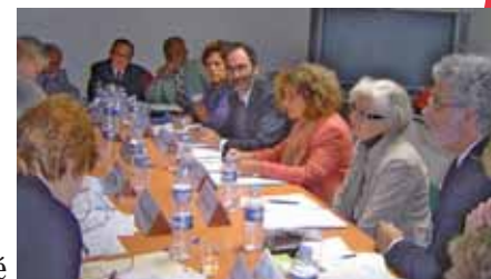
Réunion AIU-IMHE sur la gouvernance, Paris, France

Zaytoonah Jordanian National University/Al-Isra Private University/Al-Balqa Applied University (BAU)/Al-Ahliyya Amman University/Al-Bayt University/Waseda University/University of Tsukuba/University of Tokyo/University of the