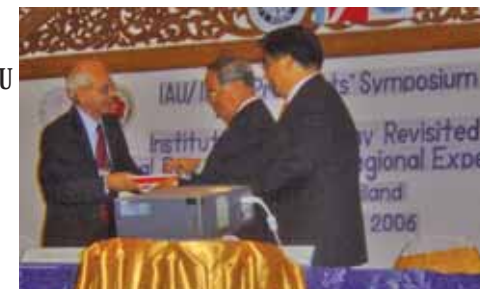
Symposium de Présidents AIU-IAUP, Chiang Mai, Thaïlande

Pour l'AIU, le Symposium fut également l'occasion de réexaminer la déclaration de principes de l'Association qui avait été élaborée à l'occasion de la conférence sur l'enseignement supérieur de l'UNESCO de 1998. Les discus-