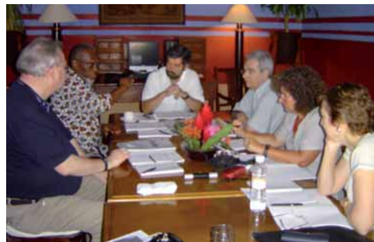
Réunion du Groupe de travail sur la collecte de fonds, Merida, Mexique

En terme de projets, le Groupe de travail a conclu que toutes les activités de l'AIU doivent être envisagées comme des sources potentielles pour le développement de projets, et cela doit être envisagé dès que de nouveaux thèmes d'activité sont envisagés. Il a été souligné qu'il serait logique que le Groupe de travail sur l'Accès à l'enseignement supérieur développe un projet pour les Membres (soit générateur de revenu, soit auto-financé) une fois que la Déclaration de principes sur ce thème sera adoptée lors de la Conférence générale en 2008.