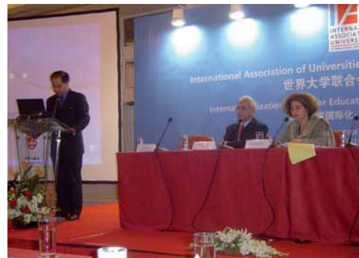
Conférence internationale de l'AIU, Pékin, Chine

l'AIU avait entrepris, démontrant ainsi que davantage d'efforts devaient être faits pour disséminer de tels outils et inviter les institutions à les utiliser dans leur travail.