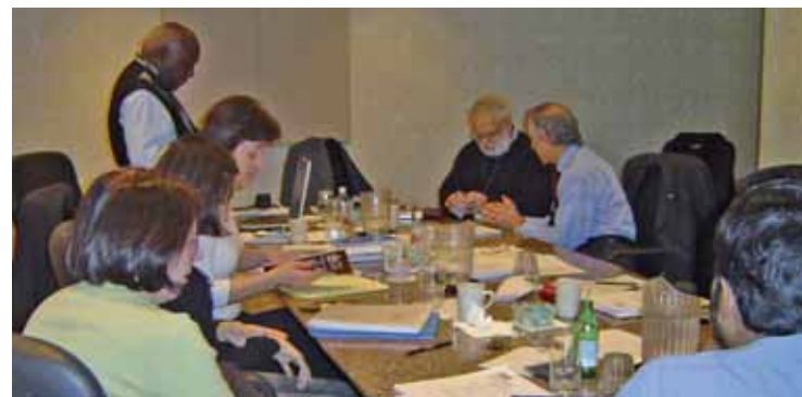
2 e Réunion du Groupe de travail sur l'Accès à l'enseignement supérieur, Washington, Etats-Unis

La décision initiale prise en 2005 par le Conseil d'administration de former un Groupe de recherche sur l'Accès à l'Enseignement supérieur était basée sur la conviction qu'augmenter et élargir l'accès à l'enseignement supérieur allaient devenir de grande importance dans de nombreux pays. Le Conseil s'était également accordé sur le fait que l'AIU détient une position unique pour aborder la problématique complexe et multidimensionnelle de l'accès, de la rétention et de l'obtention des diplômes et pour prendre en