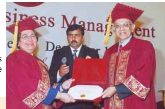
Cérémonie Doctorat Honoris Causa, Institute of Business Management, Karachi, Pakistan