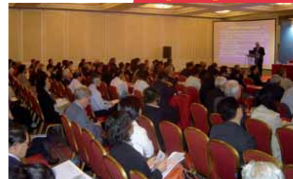
Conférence internationale de l'AIU, Pékin, Chine

Architecture and Civil Engineering/Samara State University of Economics/Rostov State University of Civil Engineering/People's Friendship University Moscow/Pacific State University of Economics/Moscow State University of Medicine and Dentistry/Moscow State Linguistic University/Moscow Power Engineering Institute,