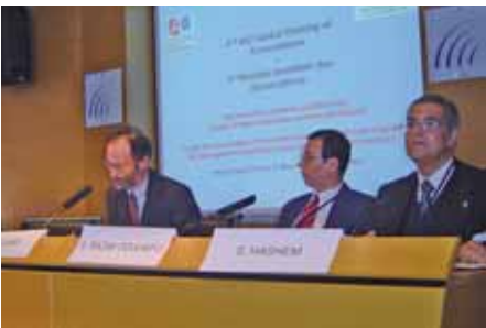
2 e Réunion mondiale des associations AIU-CPU, Paris, France

sions ont démontrée la pertinence encore actuellement de la déclaration de l'AIU sur la liberté académique, l'autonomie universitaire et la responsabilité sociale , qui a très bien résisté aux effets du temps.