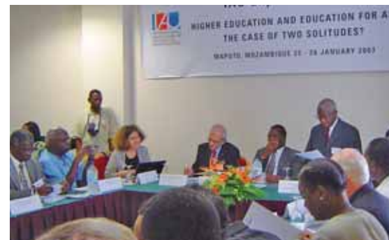
Séminaire d'experts de l'AIU, Maputo, Mozambique

Dès lors que tout ou partie du financement sera obtenu, nous tenterons d'initier des partenariats avec d'autres associations d'université, en particulier celles qui se sont impliquées dans le projet pilote (comme l'Association des Universités africaines (AAU), l'Association des Universités et Collèges du Canada (AUCC), l'Agence universitaire de la