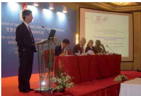
Conférence internationale de l'AIU, Pékin, Chine

Malheureusement, cet effort a montré que seuls quelques institutions et associations avaient été sensibilisées aux efforts que