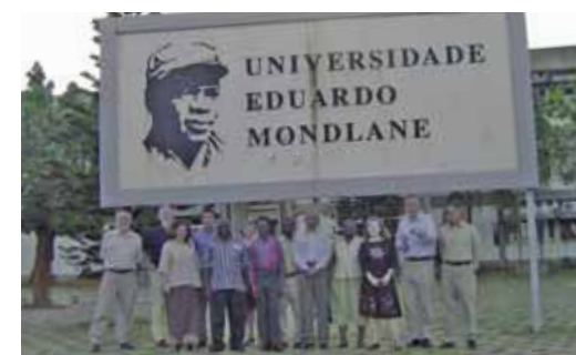
Séminaire d'experts de l'AIU, Maputo, Mozambique

L'objectif de ce nouveau projet fut d'analyser les interactions entre l'enseignement supérieur et l'EPT et de mesurer le besoin et la faisabilité d'un projet plus vaste dans ce domaine. Le projet pilote, financé en partie par Sida/SAREC a été défini et achevé en mai 2007.