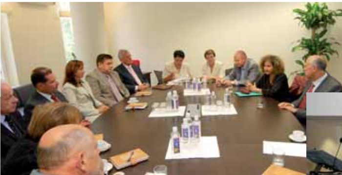
Cérémonie Membre Honoraire de Mykolas Romeris University, Vilnius, Lituanie